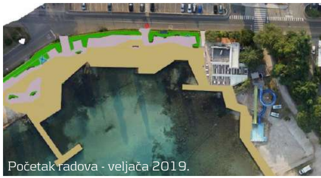
Početak radova - veljača 2019.

.. i drugi projekti koji se će kandidirati na nacionalne i EU fondove ili financirati iz proračunskih sredstava: