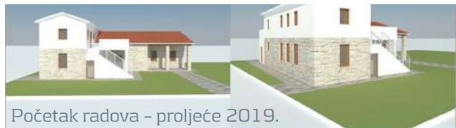
Početak radova - proljeće 2019.