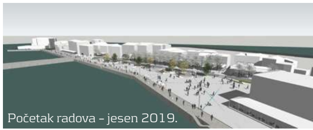
Početak radova - jesen 2019.